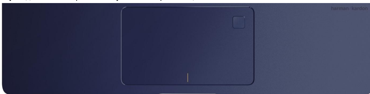
Большой тачпад со встроенным сканером отпечатков пальцев в правом верхнем углу

Тачпад ASUS ZenBook 3 обладает большей площадью по сравнению с другими ноутбуками и обеспечивает максимальную точность и комфорт. Он покрыт гладким стеклом для максимально быстрого скольжения, снабжен защитой от ложных срабатываний, а также поддерживает технологию распознавания жестов Smart Gestures (до 4 касаний одновременно) и рукописных букв. Со встроенным в тачпад сканером отпечатков пальцев больше нет необходимости набирать пароль каждый раз для входа в систему — достаточно просто коснуться сканера пальцем.