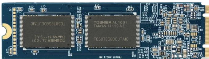
ASUS ZenBook 3 обладает сверхбыстрым SSD с интерфейсом PCIe Gen 3 x4 объемом до 1 ТБ, работающим в три раза быстрее, чем твердотельные накопители с интерфейсом SATA