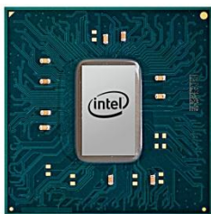
ASUS ZenBook 3 — один из самых тонких и легких ноутбуков в мире, построенный на базе мощного процессора Intel Core i7

Перед инженерами ASUS стояла почти невыполнимая задача при выборе компонентов для сверхтонкого ноутбука с беспрецедентной производительностью. В результате получился невероятно мощный ноутбук ASUS ZenBook 3 на основе процессора Intel Core i7 последнего поколения, оснащенный до 16 ГБ оперативной памяти LPDDR3, работающей на частоте 2133 МГц, сверхбыстрым SSD с интерфейсом PCIe Gen 3 x4 объемом до 1 ТБ и новейшим портом USB Type-C, к которому можно подключать даже внешний дисплей. Поэтому вашему ZenBook 3 будут под силу практически любые задачи. При установке в ZenBook 3 мощного процессора Intel Core i7 инженерам пришлось изобрести совершенно новую систему охлаждения, использующую самые современные достижения в разработке компонентов, таких, например, как крыльчатка вентилятора из жидкокристаллического полимера толщиной 0,3 мм или тепловая трубка из медного сплава с толщиной стенки всего 0,1 мм. Эта инновационная система охлаждения толщиной всего 3 мм отводит теплый воздух через скрытые в шарнире воздуховоды наружу, оставаясь эффективной и безмятежно тихой даже под продолжительной полной нагрузкой.